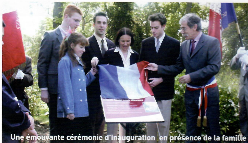
Une émouvante cérémonie d'inauguration en présence de la famille